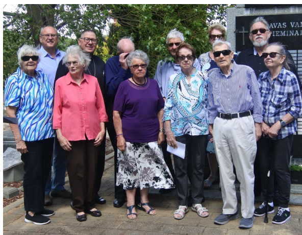
Kapu svētki 1. Maijā.

Kaut gan nupat, nesen Pertu bija piemeklējusi spēcīga negaisa vētra, pirmā marta svētdienas rīts bija skaists un saulains ar mīlīgu vēsniņu. Es to rītu pacentos Karakattas kapsētā nokļūt laikus, lai vēl varētu apmeklēt manus kapiņus, kur guldīti tēvs ar māti, mana māsiņa un pirms pieciem gadiem, mana mīļā sieviņa. Aizbraucu pie katra kapiņa noskaidrotu mazu lūgšanu un uz kapiņa uzliku svaigu puķu ziedīņu. Savai sieviņai aizdedzināju svečīti, nobirdināju vēl kādu asaru un tikai tad devos pie Pertas nodaļas Daugavas Vanagu pieminekļa, kur mēs parasti pulcējamies Kapu Svētku svinēšanai.