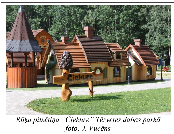
Rūķu pilsētiņa "Čiekure" Tērvetes dabas parkā