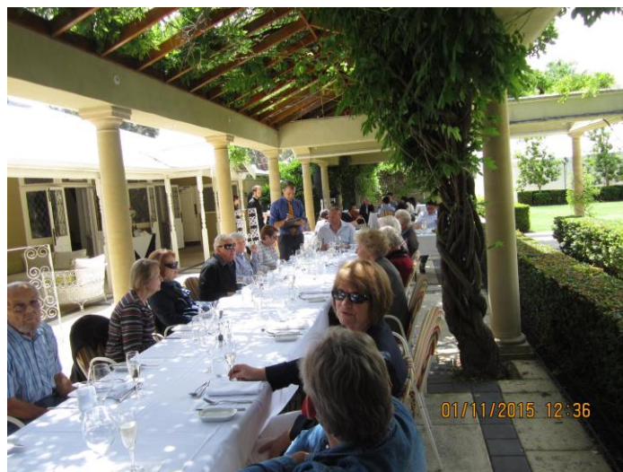
Pertas Daugavas Vanadžu 65.gadu jubilejas viesības.