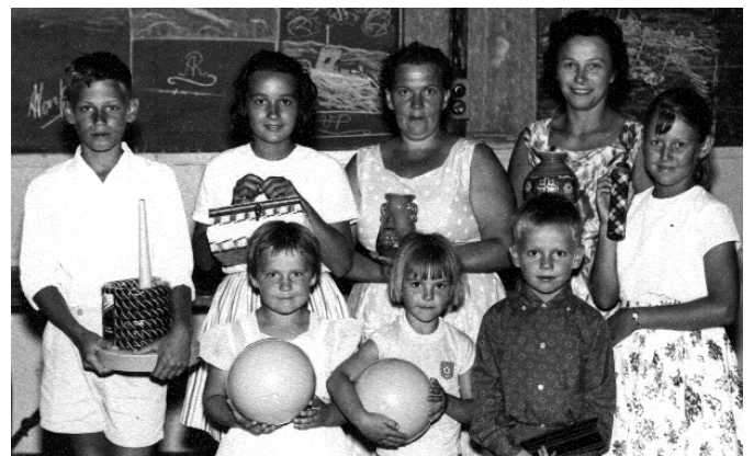
Point Peron nometne 1962.g.