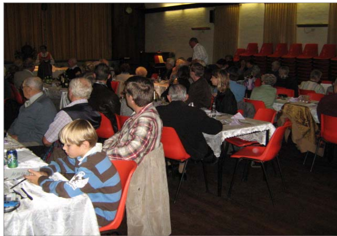
Jāņu bērni Latviešu Centrā Pertā, dzied un Līgo