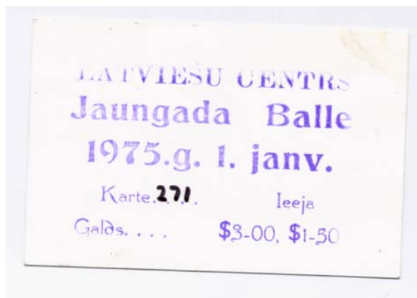
Pertas latviešu Centra 1975.g. Jaungada Balles biļete. Salīdzinājumam 2010. gada 53. KD Noslēguma balles biļetes cena $140.

Visiem Pertas Latviešiem novēlu Priecīgus Ziemassvētkus un Laimīgu Jauno Gadu.