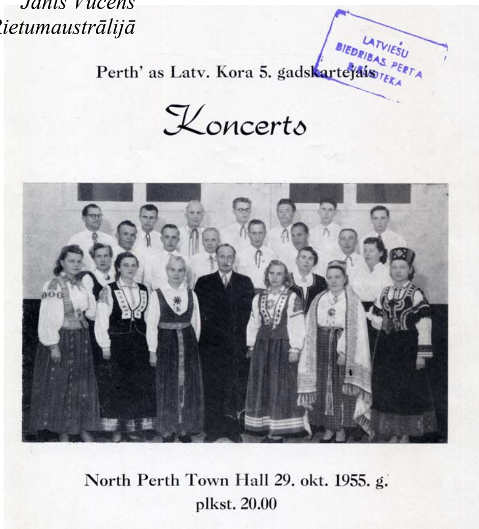
North Perth Town Hall 29. okt. 1955. g. plkst. 20.00